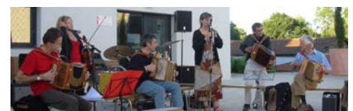
Musique traditionnelle avec les Gars de la Cuma

La Fête de la Musique a été l'occasion pour de nombreux Dompierrois de se retrouver dans le Centre Bourg pour partager un moment musical varié et convivial. Le dynamisme de "Musique à Dompierre", la participation active de Coramundi, d'Espace Jeunes, de Domp Country, la variété des groupes musicaux et l'assistance des services municipaux ont largement contribué au succès de l'édition 2008.