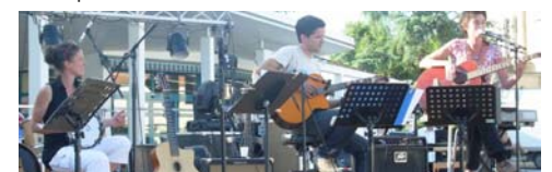
Trio de jazz manouche, Bellini Swing