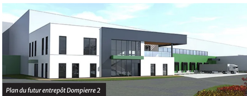
Plan du futur entrepôt Dompierre 2

Le nouvel entrepôt, d'une surface totale de 16 000 m 2 , sera destiné à répondre aux besoins croissants du Groupe Atlantic, acteur majeur de la région, qui bénéficiera de la mise en place d'un Magasin Avancé Fournisseurs (MAF) de 6 000 m 2 . Ce MAF viendra s'ajouter aux 6 000 m 2 déjà disponibles sur le site « Dompierre 1 », portant ainsi à 12 000 m 2 la capacité totale dédiée au stockage des composants. En outre, « Dompierre 2 » permettra également de