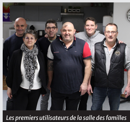
Les premiers utilisateurs de la salle des familles

Les familles dompierroises peuvent désormais réserver cette salle en mairie au 02 51 07 59 08 ou par courriel à mairie@dompierre-sur-yon.fr . Tarifs : 80 € la journée et 150 € les deux jours.