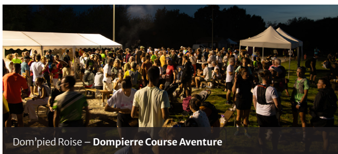
Dom'pied Roise - Dompierre Course Aventure