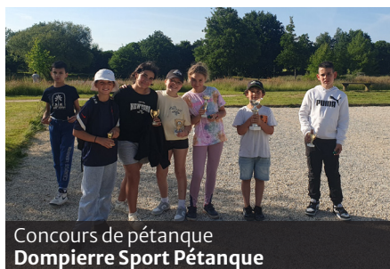
Concours de pétanque Dompierre Sport Pétanque