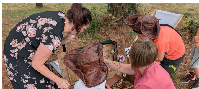
Ciné plein Air - Une vidéo retour en images est disponible sur notre page YouTube ! @mairiededompierre-sur-yon85