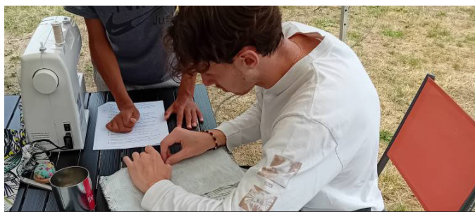
Vents d'été - Espac'Yon - 13 animations estivales