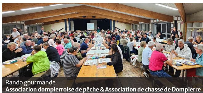
Rando gourmande Association dompiéroise de pêche & Association de chasse de Dompierre