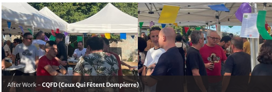
After Work - CQFD (Ceux Qui Fêtent Dompierre)