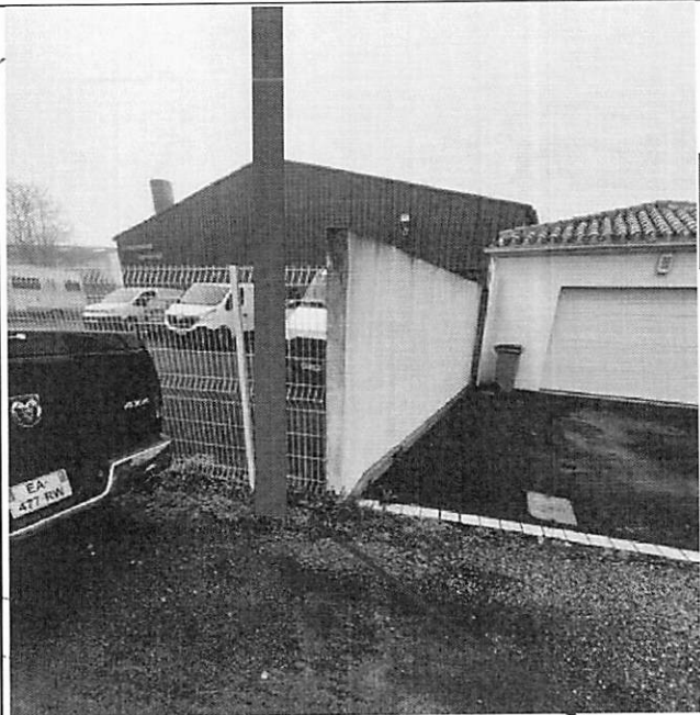
Pose d'un poteau composite 8m n° 0032037