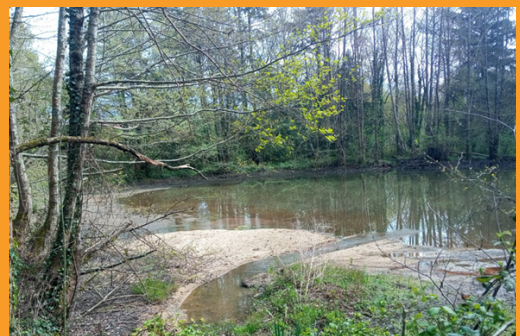
Restauration du lit mineur du ruisseau de la Margerie

Après un premier chantier participatif à l'automne et l'intervention des élèves du Lycée Nature en janvier, plusieurs opérations techniques ont été réalisées. Les équipes sont intervenues pour supprimer des ouvrages dégradés (digues et aménagements anciens) et éradiquer les bambous , espèce invasive présente sur le site.