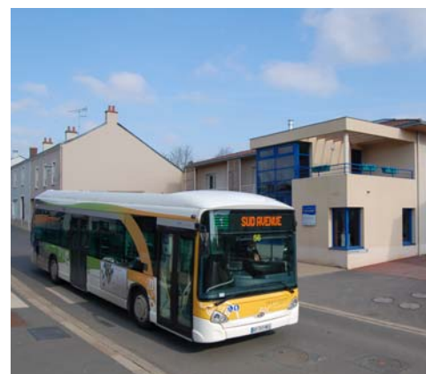
Après Dompierre, Mouilleron, Venansault et Aubigny, la commune des Clouzeaux sera desservie en septembre 2011 par une ligne régulière du bus.